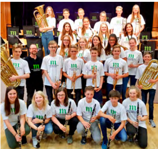
27 Schülerinnen und Schülern der Michelsenschule haben die D1 Prüfung bestanden.