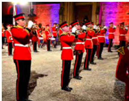
Flora Band aus Holland