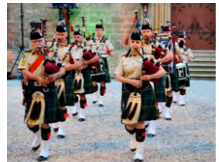
Rhine Area Pipes & Drums aus Düsseldorf