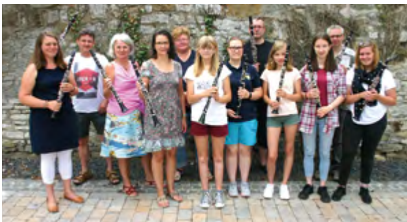
Die Teilnehmer des Klarinetten-Workshops