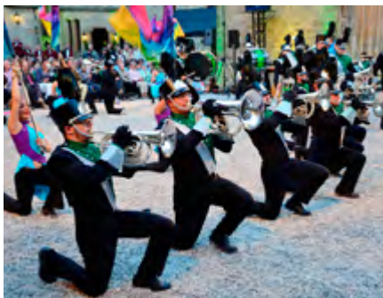
Brienza Parade Band aus Italien

the Brave“, auch Popballaden, bei denen sogar ein Keyboard zum Einsatz kam. Die „Brienza Parade Band“ war extra aus Italien angereist, um unterstützt von der farbenfrohen, flaggenschwingenden „Color Guard“ (= neun junge Damen) auf dem Innenhof der Marienburg aufzumarschieren und bunte Bilder und Klänge zu präsentieren. Trotz des etwas unebenen Kiesbelags der Spielfläche waren die präzisen Schrittfolgen und die immer neue Formen bildenden Musiker ein Fest für das Auge – leider in voller Pracht nur aus der Vogelperspektive zu erfassen. Großes Gelächter und tosenden Applaus ernteten drei elegante französische Reiter bei ihrer Trainingseinheit für die olympischen Spiele und dabei wurde so mancher Zuschauer plötzlich unfreiwillig zum Akteur des Geschehens. „Les Horsemen“ hieß dieser Walk-Act, den die französische Comedy-Truppe „Les Goulus“, die bereits mehrmals