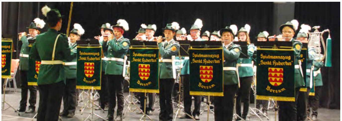
Bei der Konzertwertung auf der Bühne der Festhalle war von den Aktiven höchste Konzentration gefragt.

sprachen die Wertungsrichter von einem fulminanten und sehr guten Auftritt, obwohl sie bei der Wertung die Messlatte für alle teilnehmenden Vereine sehr hoch angelegt hatten. Zahlreiche Spielmannszüge und Blasorchester konnten die erforderliche Punktzahl für die erforderliche Qualifikation nicht erreichen. Aus dem Bereich des NMV haben sich neben dem Borsumer Stammzug in dieser Klasse zuvor nur der Spielmannszug aus Lilienthal-Falkenberg bei Bremen und der Spielmanns- und Hörnerzug aus Peine qualifiziert. Die Borsumer muss-