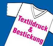
Textildruck & Bestickung