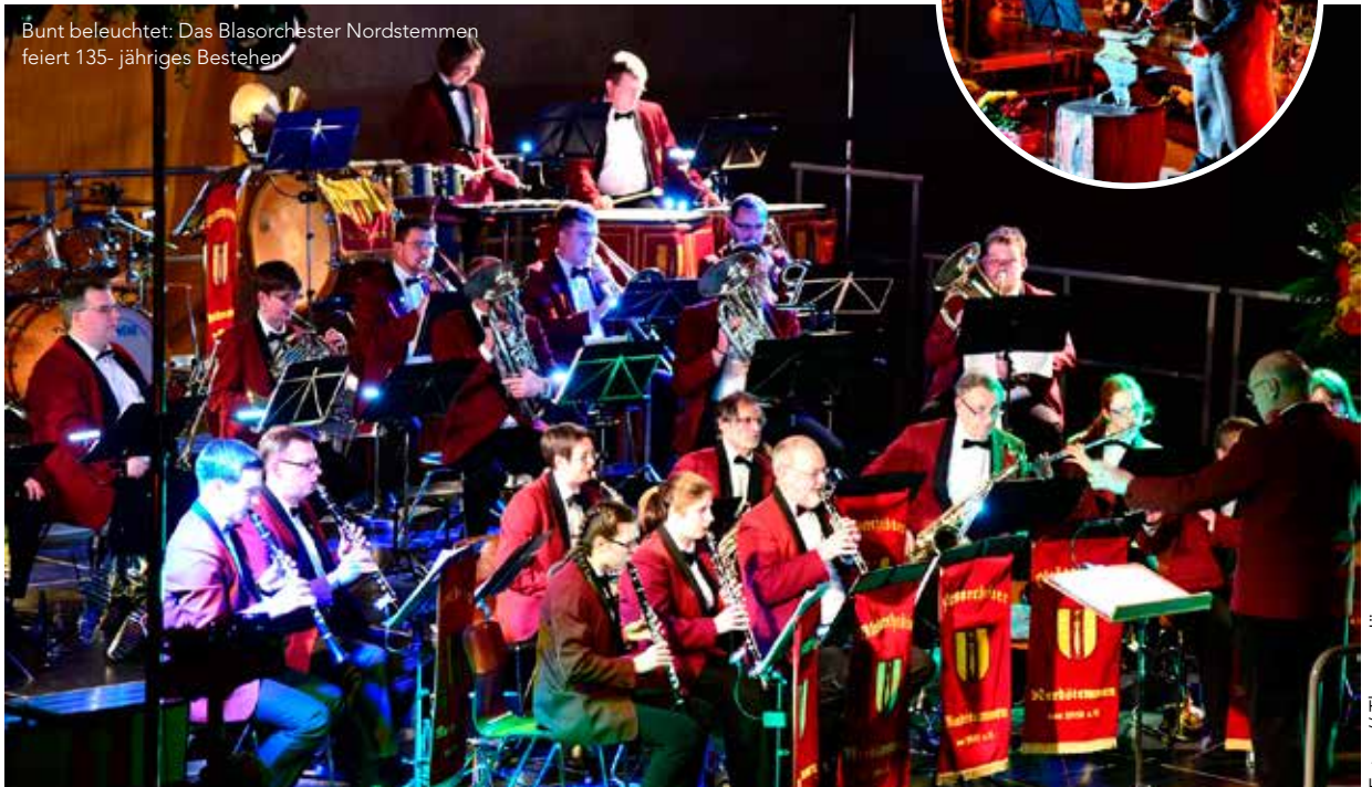
Bunt beleuchtet: Das Blasorchester Nordstemmen feiert 135-jähriges Bestehen

niges geboten. Bei der Filmmusik „Backdraft – Männer die durchs Feuer gehen“ marschierten tatsächlich zwei Feuerwehrmänner in Atemschutzanzügen auf die Bühne und bei der „Feuerfest-Polka“ bearbeitete Schlagzeuger Sören Gehler mit viel Schmackes den Amboss. Mitten in der „Feuerfest-Party“ verließen die Musiker kurzerhand die Bühne und ließen Adrian Funke und Sören Gehler ein fünfminütiges eindrucksvolles Schlagzeug-Feuerwerk abbrennen. Ob „Ring of fire“, „Atemlos“ oder beim „Marschkonfetti“, die Musiker wussten in allen Musikgattungen zu überzeugen. Dem großen Applaus nach zu urteilen, war das Publikum „Feuer und Flamme“ für „sein“ Blasorchester und so gab es am Schluss viel lobende Worte und ein Flachgeschenk von der stellvertretenden Landrätin Waltraud Friedemann und Ortsbürgermeister Bernhard Flegel. Das Orchester revanchierte sich dafür mit einigen schmissigen Zugaben, bevor sich die Zuhörer dann gut aufgeheizt auf den frostig-kalten Nachhauseweg machten. // THOMAS JÄGER