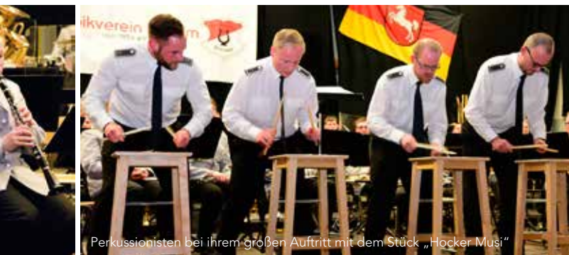
Perkussionisten bei ihrem großen Auftritt mit dem Stück „Hocker Musi“

vier mit ihren Drumsticks auf die Hocker niederprasseln ließen, grenzte es fast an ein Wunder, dass nichts zu Bruch ging. Weitere Originalkompositionen rundeten das Programm ab und in einem sehr transparent arrangierten langen Musicalmedley konnte das Publikum zum Abschluss noch einmal jedes Register in feinen solistisch eingestreuten Passagen erleben. Der lange, nicht enden wollende Applaus war ein schöner Lohn für die hervorragende Darbietung der Profis aus Hannover und gleichzeitig die Bitte, gerne wieder nach Borsum zu kommen. Auch die Gäste aus Hameln würden sich bestimmt darüber freuen. // THOMAS JÄGER