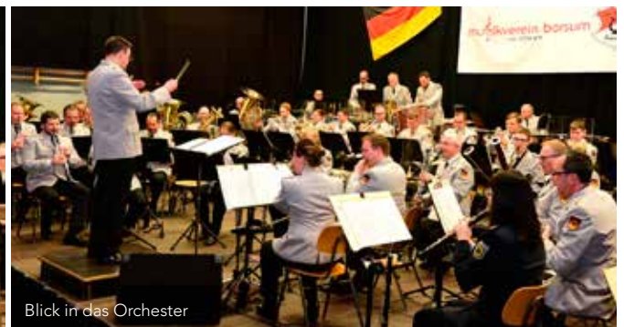
Blick in das Orchester