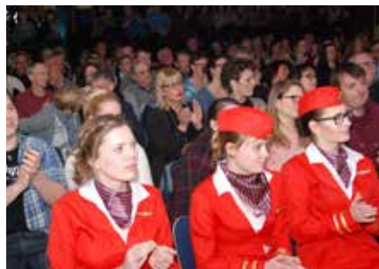
Nicht nur die Stewardessen, sondern auch das Publikum war von dem Orchesters begeistert.