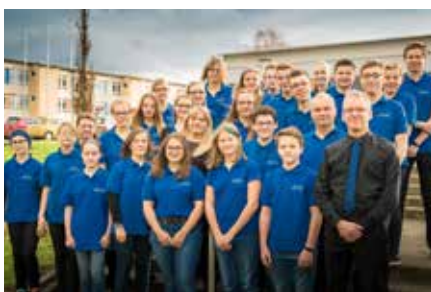
Nachwuchsorchester des Sarstedter Bläserorchesters