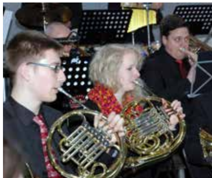
Blick ins Orchester (Projekt 2018)