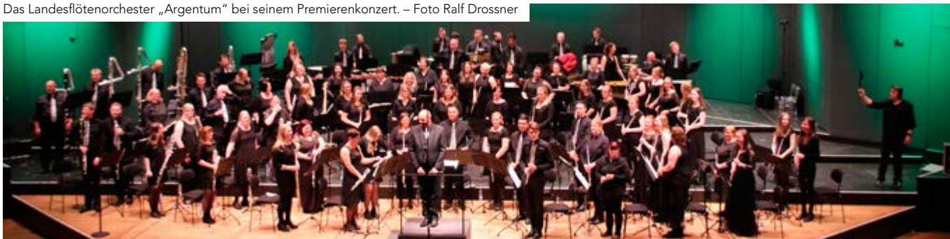
Das Landesflötenorchester „Argentum“ bei seinem Premierenkonzert.