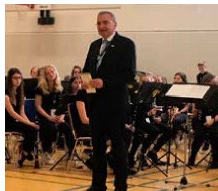
Präsident der BDMV Paul Lehrieder