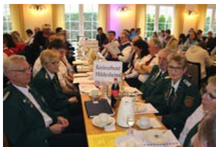
Delegierten des Kreismusikverbandes Hildesheim